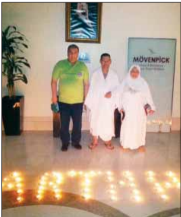
شهادة الكوكب الأخضر

حصل فندق موفنيك مكة من جديد على شهادة الكوكب الأخضر المعتمدة دولياً لمعايير الاستدامة والبيئة النظيفة لقطاع السياحة، بعد أن اجتاز بنجاح الاختبارات السنوية لعام 2014، الخاصة بتطبيق شروط معايير الاستدامة التي تعتمدها الشهادة.