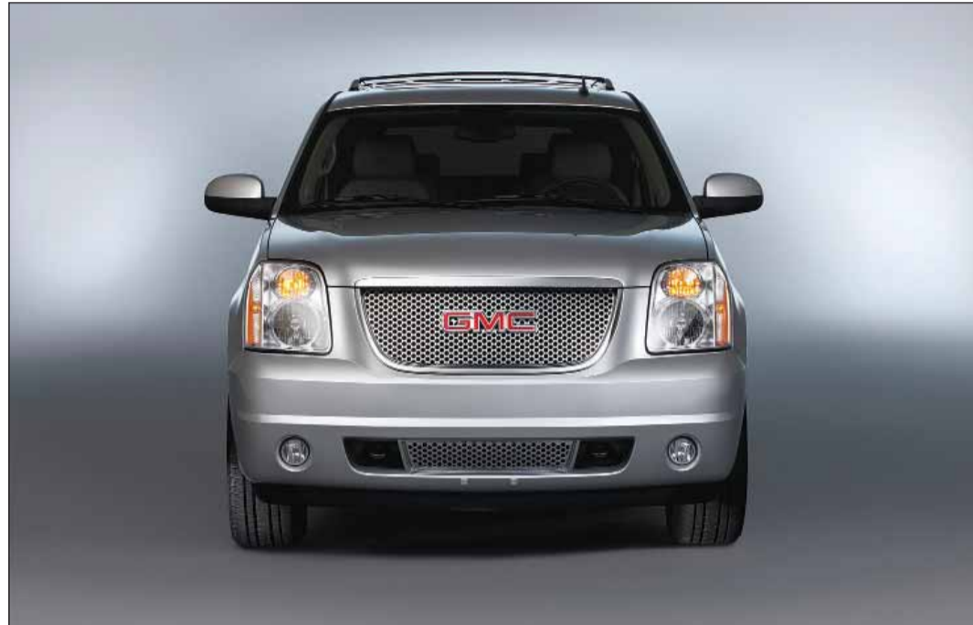
جي إم سي يوكن 2014 متوافرة حالياً في جميع صالات العرض في المنطقة

دبي - لطالما كان الإبداع والتميز في مجال السلامة والأمان من أهم المبادئ التي نتبنها علامة جي إم سي. وبالطبع، لا تخالف عائلة جي إم سي يوكن ويوكن XL في هذا العام ذلك التوجه. فهي تتميز بهيكلها قوي البنية المصمم لامتصاص الطاقة الصادرة من الاصطدامات وتوفير «قفص حماية» حول الركاب.